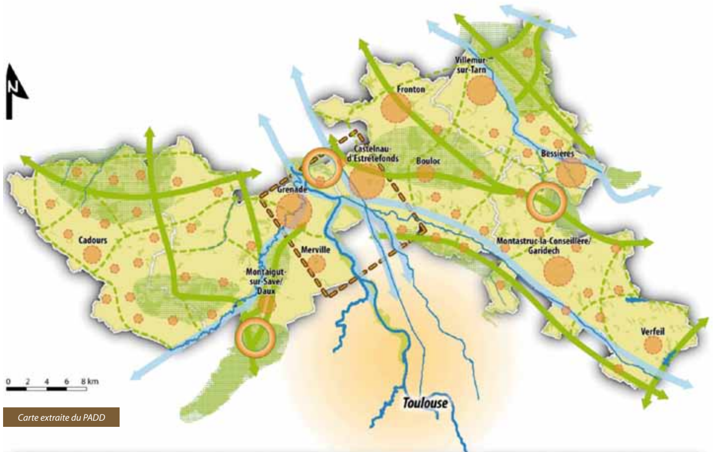
Carte extraite du PADD